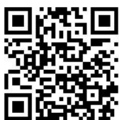
総会・懇親会準備ページ