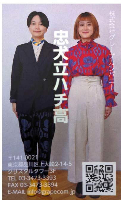
忠犬立ハチ高名刺コピー